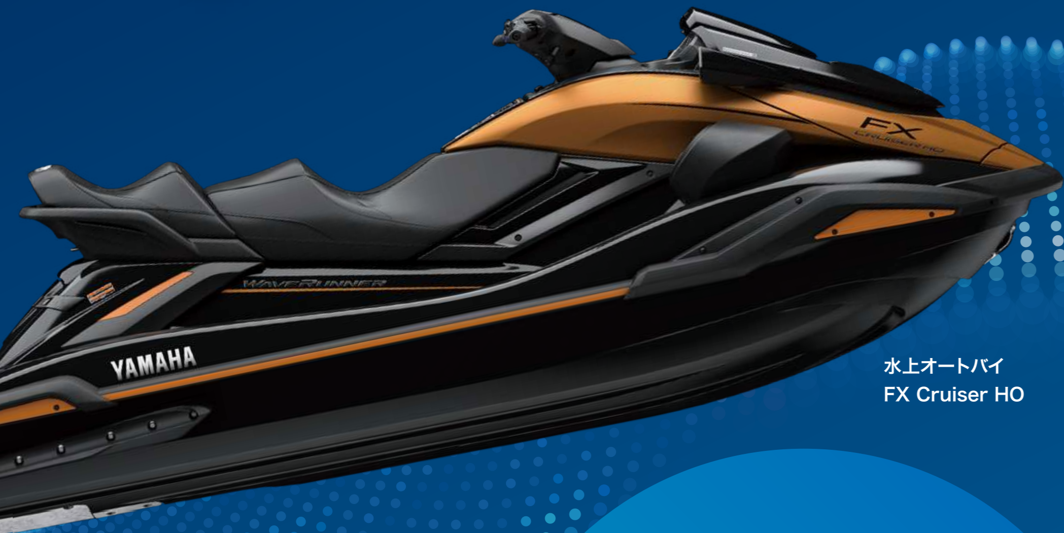
水上オートバイ FX Cruiser HO