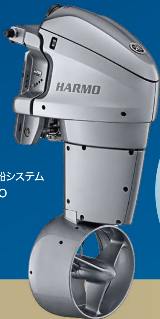
電動操船システム HARMO