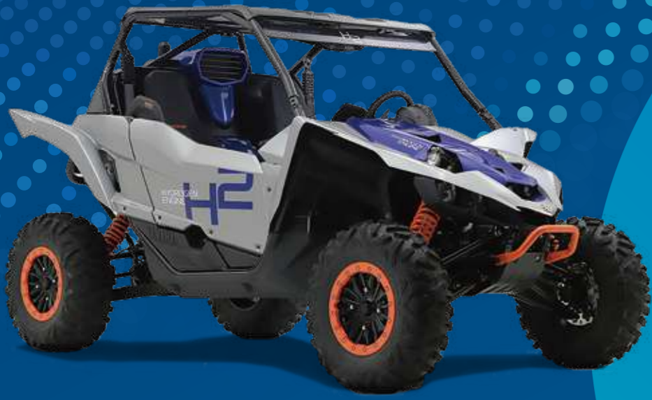
水素エンジン搭載四輪バギー YXZ1000R