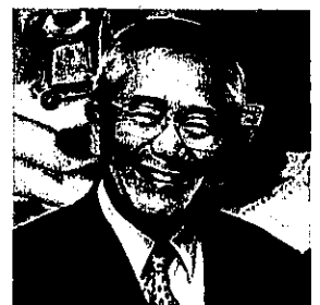
米パデュー大学 根岸 英一特別教授 (帝人グループ名誉フェロー) 帝人久村奨学生第5回生(1957年)

そして自らの「夢」を見つけたら真理を突き詰めるまで、とことんチャレンジしてください。今後の皆さんの大いなる活躍に期待しています。