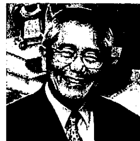
故 根岸 英一 氏 帝人久村奨学生第5回生(1957年)

そして自らの「夢」を見つけたら真理を突き詰めるまで、とことんチャレンジしてください。今後の皆さんの大いなる活躍に期待しています。