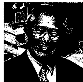
米パデュエ大学 根岸 英一特別教授 (帝人グループ名誉フェロー) 帝人久村奨学生第5回生(1957年)

そして自らの「夢」を見つけたら真理を突き詰めるまで、とことんチャレンジしてください。今後の皆さんの大いなる活躍に期待しています。