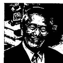
Purdue University Distinguished Professor Mr. Ei-ichi Negishi (Teijin Group Distinguished Fellow) 5th year Teijin Kumura scholarship (1957)

When you find your own "Dream", please challenge it thoroughly until the truth is investigated. I look forward to your great success in the future.