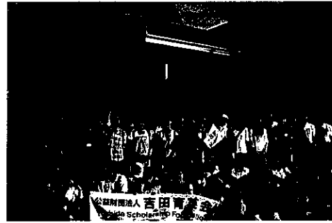
奨学生夏季研修旅行