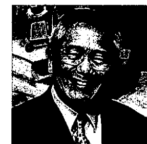
米パデュー大学 根岸 英一特別教授 (帝人グループ名誉フェロー) 帝人久村奨学生第5回生(1957年)

そして自らの「夢」を見つけたら真理を突き詰めるまで、とことんチャレンジしてください。今後の皆さんの大いなる活躍に期待しています。