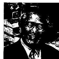
Purdue University Distinguished Professor Mr. Ei-ichi Negishi (Teijin Group Distinguished Fellow) 5th year Teijin Kumura scholarship (1957)

When you find your own "Dream", please challenge it thoroughly until the truth is investigated. I look forward to your great success in the future.