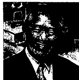
米パデュー大学 根岸 英一特別教授 (帝人グループ名誉フェロー) 帝人久村奨学生第5回生(1957年)

そして自らの「夢」を見つけたら真理を突き詰めるまで、とことんチャレンジしてください。今後の皆さんの大いなる活躍に期待しています。