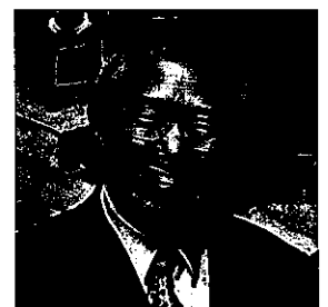
米パデュー大学 根岸 英一特別教授 (帝人グループ名誉フェロー) 帝人久村奨学生第5回生(1957年)

そして自らの「夢」を見つけたら真理を突き詰めるまで、とことんチャレンジしてください。今後の皆さんの大いなる活躍に期待しています。